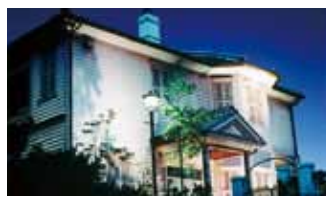
南山手地區 街道保存中心

日本國家的重要文化財。是由建築界的奇才、下田菊太郎所設計的。位於市內，是採用希臘古典建築樣式科林斯式建設的石製洋房，晚上點燈在燈光的照射下洋溢歷史氛圍莊嚴肅穆。