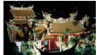
孔子廟·中國歷代博物館

日本最古老的教堂，被認定為國寶。1864(元治1)年完工，教堂則在1879(明治12)年「信徒發現」後改建的。教堂建築物是用瓦片建造的平房(創建時的教堂是木造的)。晚上則在白色燈光與黑色陰影的交錯下風情萬種。