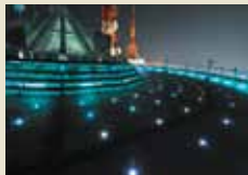
稻佐山山頂展望台

KEN OKUYAMA DESIGN 設計的全面玻璃造型的空中纜車,提供瞭望長崎一望無際的美景。歡迎搭乘空中纜車享受空中散步。