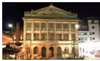
舊香港上海銀行 長崎支店紀念館

日本國家的重要文化財。是由建築界的奇才、下田菊太郎所設計的。位於市內，是採用希臘古典建築樣式科林斯式建設的石製洋房，晚上點燈在燈光的照射下洋溢歷史氛圍莊嚴肅穆。